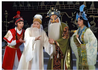
照片：程婴救孤剧照

全国各地早在明清时期，就出现了争夺程婴名人现象。特别是进入改革开放时期，山西的襄汾、孟县、忻州市相互争夺。程婴之争从山西蔓延到全国，陕西韩城市也发声说，程婴是韩城市南堡安村人。河北省井陘县也有赵孤园，说程婴是井陘人，内丘临县邢台县有赵孤庄，程婴是邢台人。可内丘人都认为程婴是名垂青史、戏曲中的人物，和内丘没有关联。